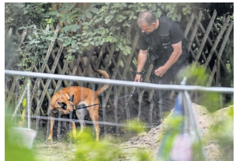
Germany police officers search with dogs an allotment garden plot in Seelze, near Hannover, Germany, Wednesday, July 29, 2020.

At the garden plot, investigators chopped off trees, shoveled away the ground, searched the premises with a sniffer dog and removed parts of the foundation of